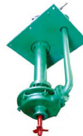
CYL 新型立式长轴液下带搅拌泵