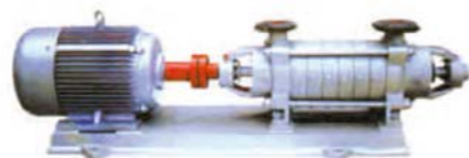
CDG 系列卧式多级锅炉给水泵