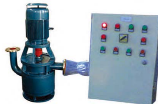
CLZ 新型无阀立式自吸泵