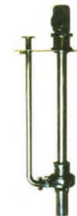
CYL 新型立式长轴液下泵 (双轴承支承结构专利技术)